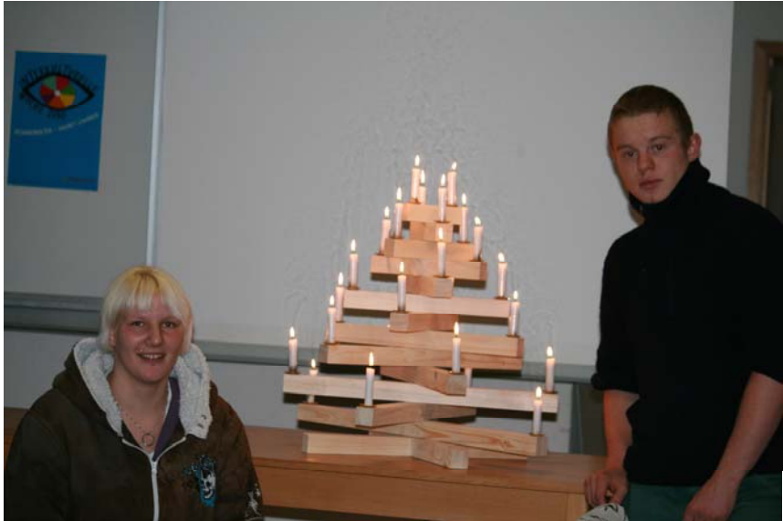
Kundenaufträge werden stolz vorgestellt

Ein guter Teil der Jugendlichen ist offenbar begeistert davon, vieles lernen zu können, ohne auf der Schulbank sitzen zu müssen. Würden sie sich sonst in der Mittagspause ihre „Kundenaufträge“ mit ziemlichem Stolz vorstellen?