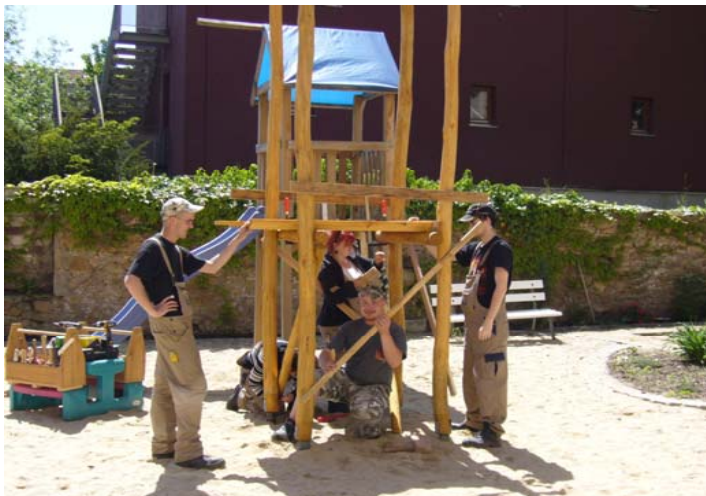
Jugendliche präsentieren, dass von ihnen erstellte Produkt