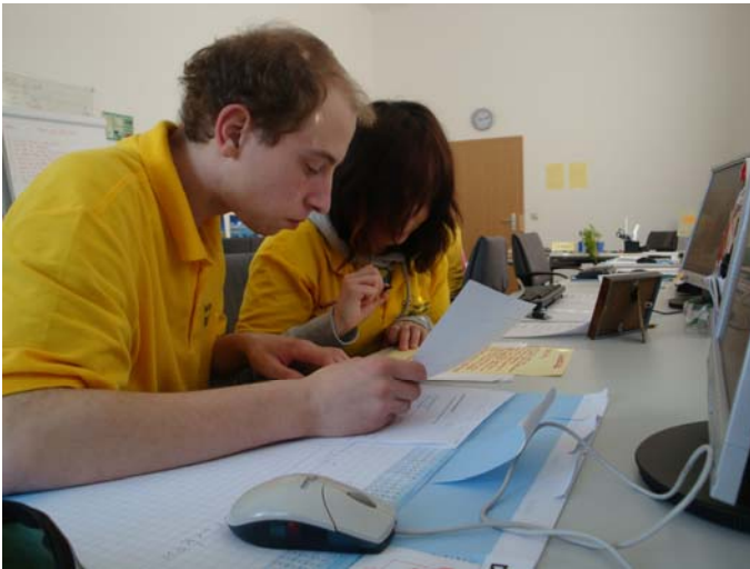
Jugendliche im Büro bei der Auftragsannahme

Die „Neue Produktionsschule Moritzburg“ ist ein Projekt der arbeitsweltbezogenen Jugendsozialarbeit. Das Projekt dient der Berufsorientierung und –vorbereitung benachteiligter junger Menschen, die von bestehenden Berufseinstiegsprojekten und Ausbildungsmaßnahmen nicht (mehr) erreicht werden. Die „Neue Produktionsschule Moritzburg“ ist sächsisches Modellprojekt und wird durch den Europäischen Sozialfonds (ESF), den Freistaat Sachsen und den Landkreis Meißen finanziert.